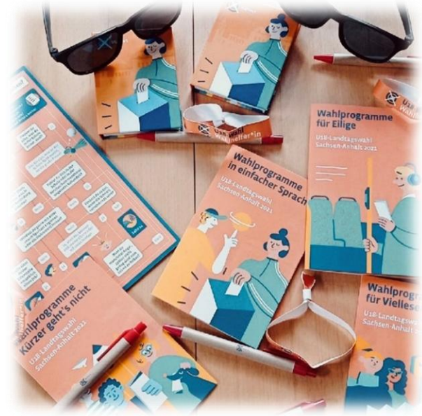
Materialbeispiel aus 2021

Für die Weiterleitung der Ergebnisse braucht ihr ein Tablet oder PC mit Internet.