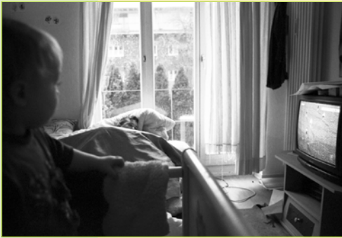
„Armut engt ein“

Kinder wurden lange Zeit nicht als eigene von Armut betroffene Bevölkerungsgruppe wahrgenommen, sondern galten vielmehr als Ursache für