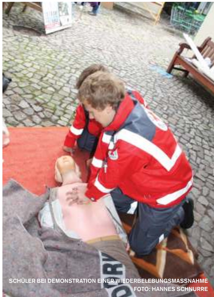
SCHÜLER BEI DEMONSTRATION EINER WIEDERBELEBUNGSMASSNAHME